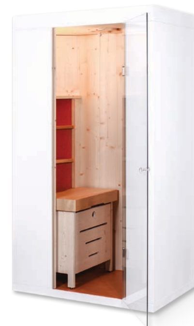
Hydrosoft® Wellness Sauna